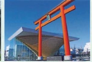
富士山世界遺産センター (富士宮駅から歩いて8分)