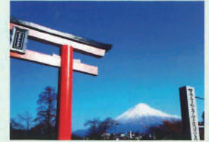
大社と富士山 (富士宮駅から歩いて10分)