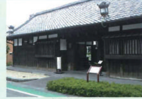
長屋門 (富士宮駅から歩いて10分)